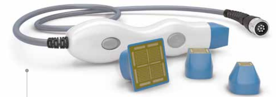
Technologie fractionnée : l'évolution que vous cherchiez

Seulement avec Rinnova Plus Frax vous pouvez pousser sur l'accélérateur pour donner de la puissance comme vous ne l'avez jamais fait auparavant, en garantissant à vos clients des traitements exclusifs, extraordinairement